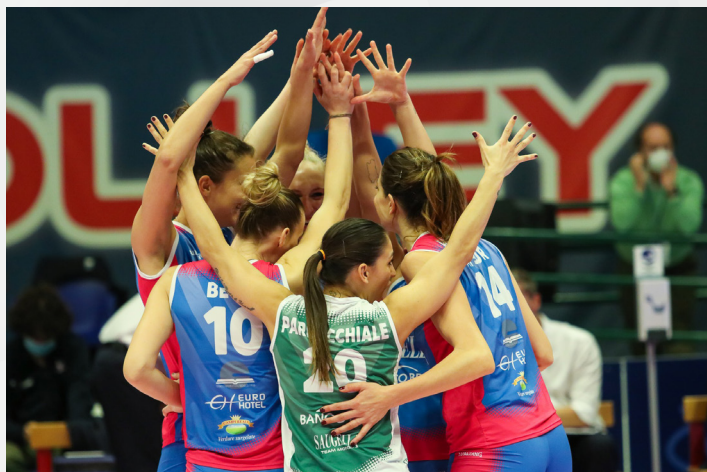
L'esultanza della Saugella Monza

Una vittoria, purtroppo tre sconfitte con due tiebreak fatali e un rinvio. È quanto propone alle squadre lombarde la dodicesima giornata di A1 femminile.